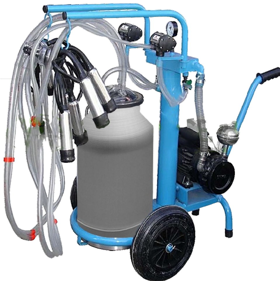
Рисунок 1 – Агрегат

АИД-2 комплектуется двумя пульсаторами, вакуумметром, соединительными шлангами и доильной аппаратурой.