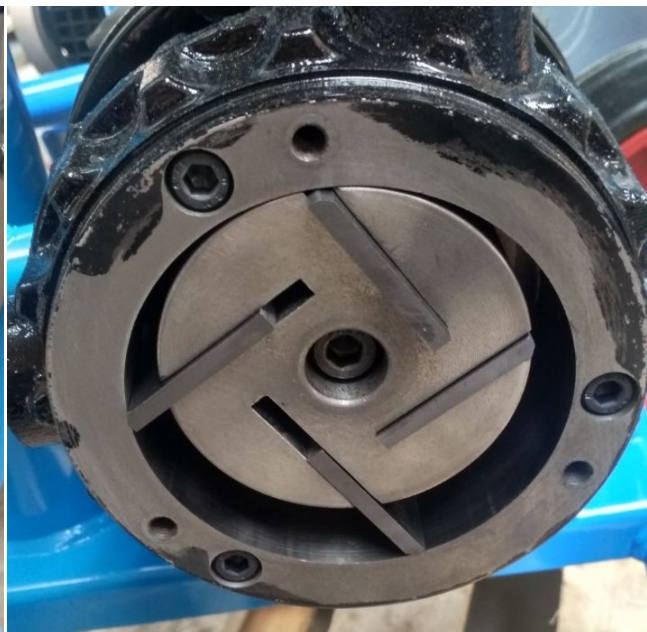
Рисунок 5 – Положение лопаток