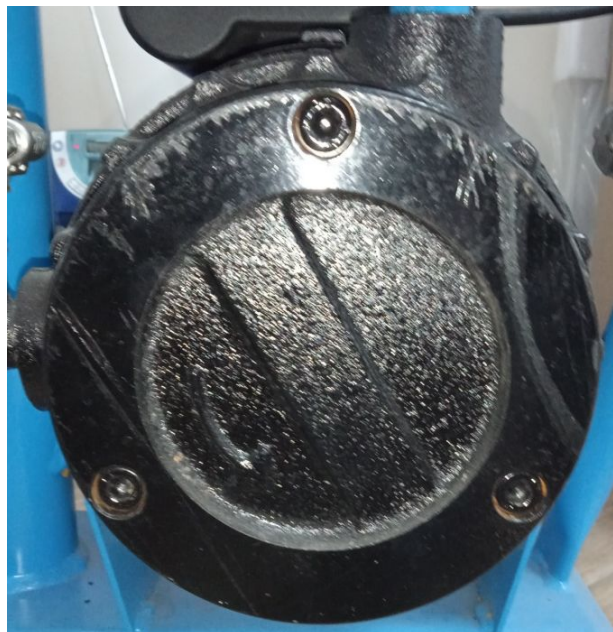
Рисунок 4 – Крышка с винтами

Для замены или чистки графитовых лопаток необходимо открутить 3 винта с внутренним шестигранником и снять крышку (рисунок 4). Лопатки устанавливать скошенным краем к отверстию корпуса (рисунок 5).