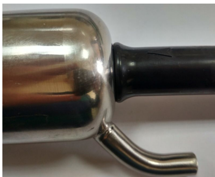
Рисунок 3 – Положение уплотнительного кольца

Поднять по очереди каждый доильный стакан головкой вверх и вставив в него большой палец руки, убедиться в пульсации сосковой резины.